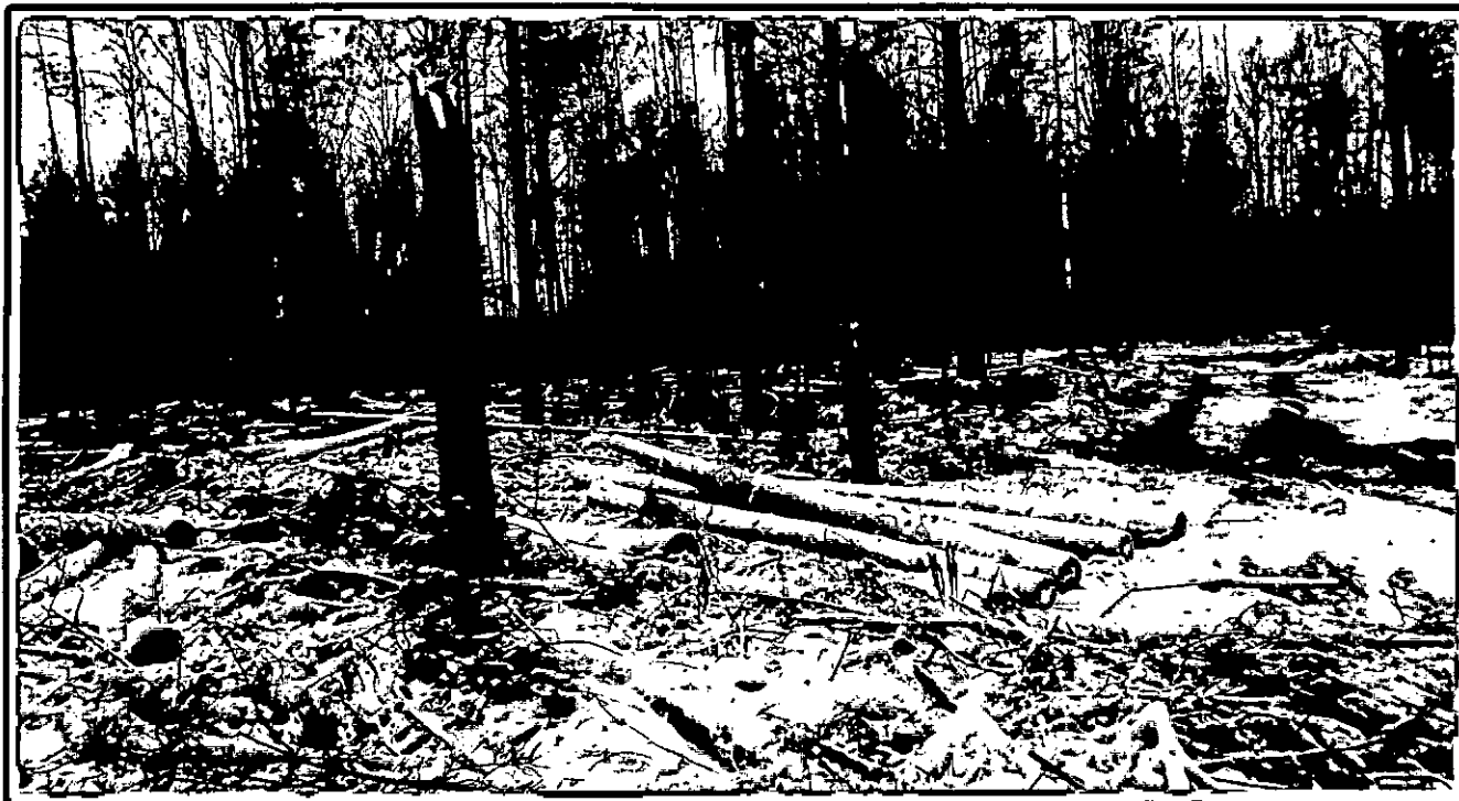
Изображение № 7 Брошенная древесина вдоль лесовозных дорог. Не является валежником