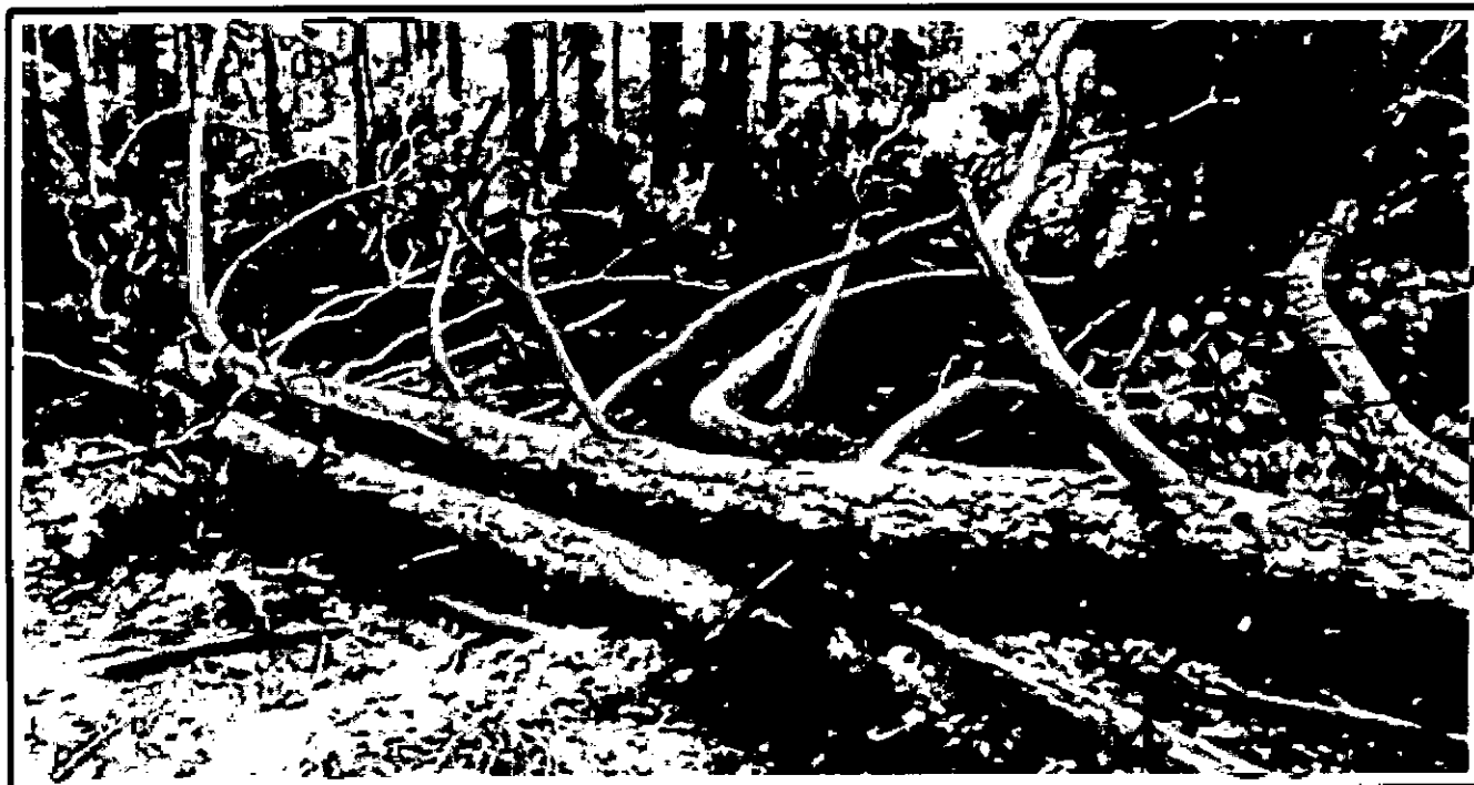
Лежащее на поверхности земли ветровальное дерево, не имеющее признаков отмирания. Не является валежником

Кроме того, необходимо обратить внимание, что деревья, которые лежат на земле, но не имеют признаков естественного отмирания (имеют зеленую листву или хвою), определять как «мертвые» не допускается (смотри изображение № 5).