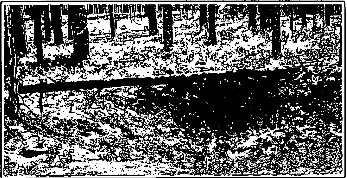
Изображение № 3 Валежник