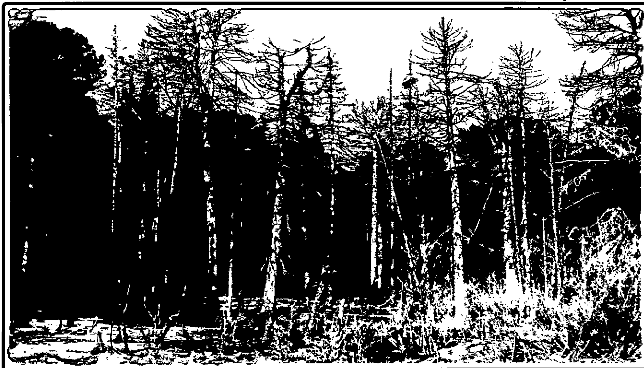
Изображение № 4 Сухостойное дерево. Не является валежником Изображение № 5

Кроме того, необходимо обратить внимание, что деревья, которые лежат на земле, но не имеют признаков естественного отмирания (имеют зеленую листву или хвою), определять как «мертвые» не допускается (смотри изображение № 5).